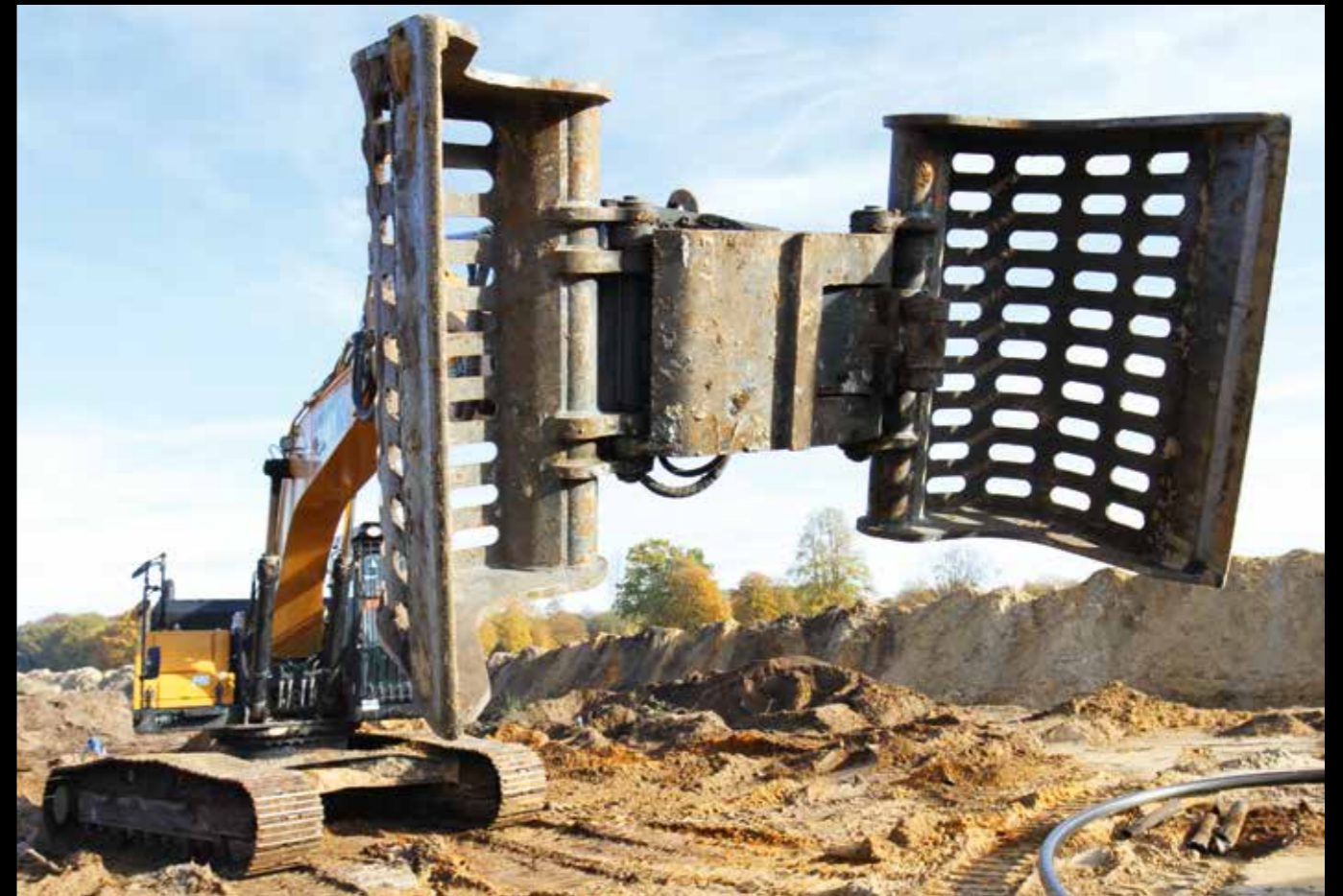
Der Betongreifer ist dank Oilquick-Schnellwechsler in Sekunden angebaut und packt am SY265C LC eisenhart zu