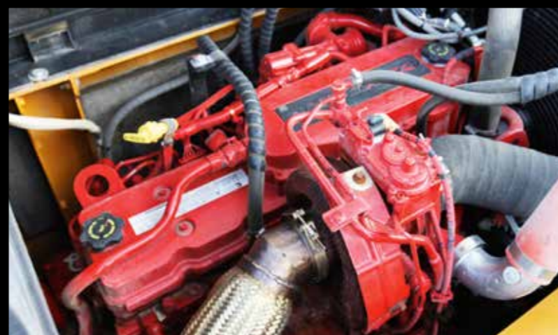
Oben: Kawasaki-Hydraulikpumpe sorgt für einen Ölfluss von 2 x 246 l Rechts: Der Cummins QSB6.7 liefert eine Leistung von 142 kW/193 PS und erreicht die Abgasstufe Tier 4 final

Anfallende Recyclingarbeiten und Materialaufarbeitung würden dabei vor Ort erfolgen. Mit diesem Konzept hat er sein Unternehmen durchaus erfolgreich am Markt platziert und baut in der Hansestadt Hamburg gerade einen zweiten Standort auf. „Wir arbeiten mit namhaften, großen Bauunternehmen zusammen“, kommt er dann noch einmal auf den Sany SY265C LC zu sprechen, „da bewährt sich der 265er noch an einer ganz anderen Front: Immer mehr wird nämlich der Einsatz emissionsarmer Maschinen eine