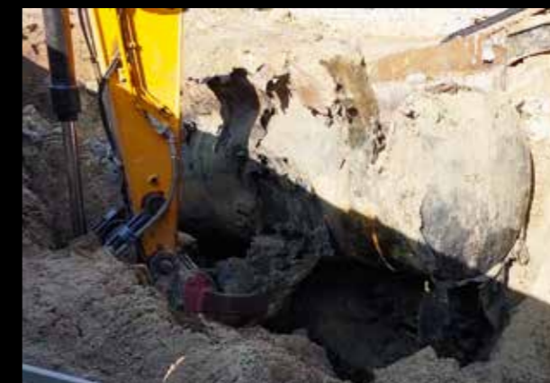
Höchstleistung: der SY265C LC wuchtet einen mit Beton gefüllten 20.000-l-Tank aus dem Erdreich

ehemaligen Bebauung im Boden stecken. Daher ist es häufig nötig, das Anbaugerät zu tauschen, und statt der Planierschaufel auf den Greifer zu wechseln. Dank des montierten Oilquick-Schnellwechslers dauert das allerdings nicht einmal eine Minute. Selbst größere Fundamente bis hin zu massiven Schachtfertigteilen zieht der SY265C LC mit dem Greifer souverän aus dem Boden. Wirkliche Höchstleistung musste Meyer seinem chinesischen Bagger erstmals auf einer inzwischen abgearbeiteten Baustelle in Delmenhorst abverlangen: „Hier steckte ein zur Hälfte mit Beton gefüllter 20.000-Liter-Tank im Boden, den wir da unbedingt herausholen mussten. Nachdem ein 30-Tonnen-Bagger damit nicht klarkam, bin ich da mit meinem Sany ran. Der hat zwar ein bisschen gemurrt und wäre dabei fast vornüber gekippt – am Ende hat er das Teil aber komplett herausgezerrt.“