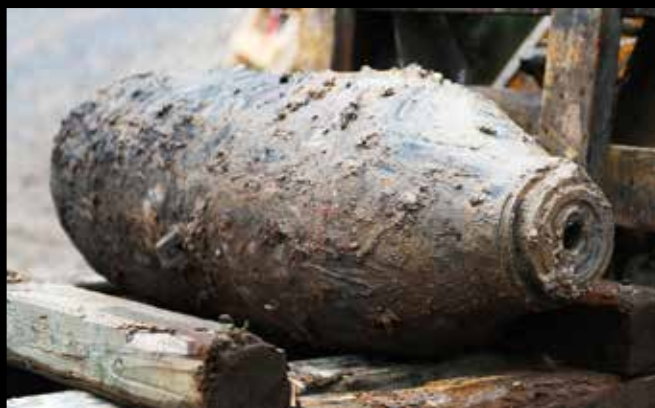
Todbringender Fund: amerikanische 5-Pfund-Bombe