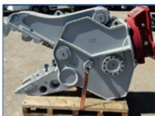
Demarec DRP25 Pulverisierer, generalüberholt, Trägergerät 18-25 to., Einsatzgewicht 1.910 kg., Schließkraft 85/130 to., Preis: 37.500€