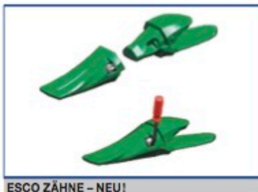
ESCO ZÄHNE – NEU! Direkt vom Hersteller an Ihre Schaufel! Wir bieten ihnen alle Varianten zu günstigen Konditionen ..... Alle Preise auf Anfrage!