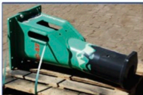
Montabert SC42 hydr. Hammer, NEU, Trägergerät 4,0-12,0 to., Einsatzgewicht 445 kg., Aufnahme nach Wunsch gegen Aufpreis, Preis: 8.800€