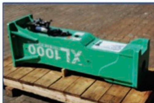
Montabert XL1000 hydr. Hammer, NEU, Trägergerät 11,0-17,0 to., Einsatzgewicht 980 kg., Aufnahme nach Wunsch gegen Aufpreis Preis: 17.500€