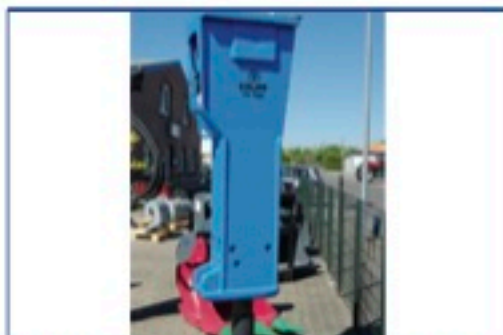
Krupp HM1000 hydr. Hammer, komplett überholt, Trägergerät 18,0-28,0 to., Einsatzgewicht 1.710 kg., ohne Schläuche und Kopfplatte, Preis: 15.900€