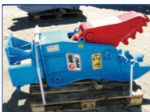
MBI RP07 Pulverisierer, NEU, Trägergerät 6-9 to., Einsatzgewicht 660 kg., Schneidkraft 133 to., Preis: 18.000€