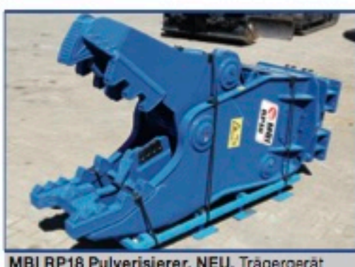
MBI RP18 Pulverisierer, NEU, Trägergerät 18-26 to., Einsatzgewicht 2.000 kg., Schneidkraft 230 to., Aufnahme nach Wunsch gegen Aufpreis, Preis: 26.800€