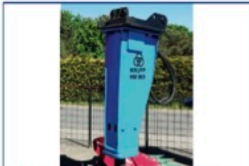
Krupp HM960 hydr. Hammer, Bj. 2010 kompl. Überholt, Einsatzgewicht 1.600 kg, Schläuche, Lehnhoff MS21 Preis: 15.300€