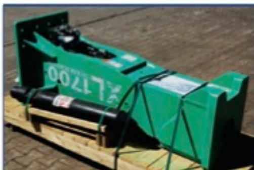
Montabert XL1700 hydr. Hammer NEU, Trägergerät 18,0-28,0 to., Einsatzgewicht 1660kg., Aufnahme nach Wunsch gegen Aufpreis, Preis: 23.500€