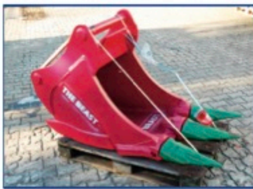
The Beast - NEU, Aufnahme nach Wunsch, komplett HARDOX 450, extrem robust, ESCO Ultralock Zähne, Preis auf Anfrage