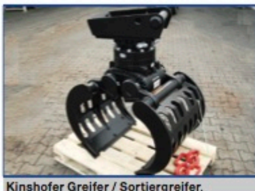
Kinshofer Greifer / Sortiergreifer, verschiedene Ausführungen, von 1 bis 50 to. Klasse, div. Aufnahmen Preise auf Anfrage

Weitere Daten und Details auf Anfrage! Die angegebenen Preise sind Nettopreise! – Es gelten unsere AGB