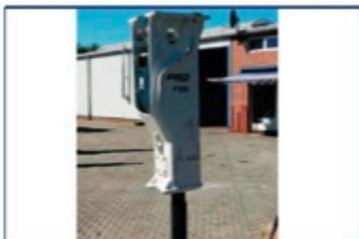
Furukawa FRD F22 hydr. Hammer, Bj. 2017 kompl. Überholt, Einsatzgewicht 1.410 kg., Trägergerät: 16,0-25,0 to., ohne Schläuche und Kopfplatte, Preis: 16.500€