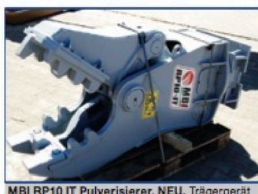
MBI RP10 IT Pulverisierer, NEU, Trägergerät 10-18 to., Einsatzgewicht 1.100 kg., Schneidkraft 159to., Aufnahme nach Wunsch gegen Aufpreis, Preis: 26.000€