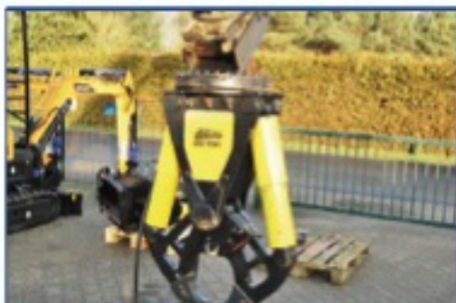
Darda CC700 Betonzange - Betonbrecher, Bj. 2014, Eigengewicht 530 kg., Trägergerätgewicht 7-15 to., Brechspitzen und Messer NEU, Aufnahme MS08 Preis: 17.500€