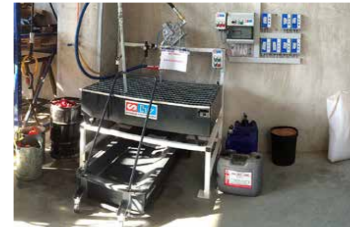
Zentrale Altölsammelstation mit Füllstandsüberwachung und vollautomatischer Entleerung in den Altölsammeltank