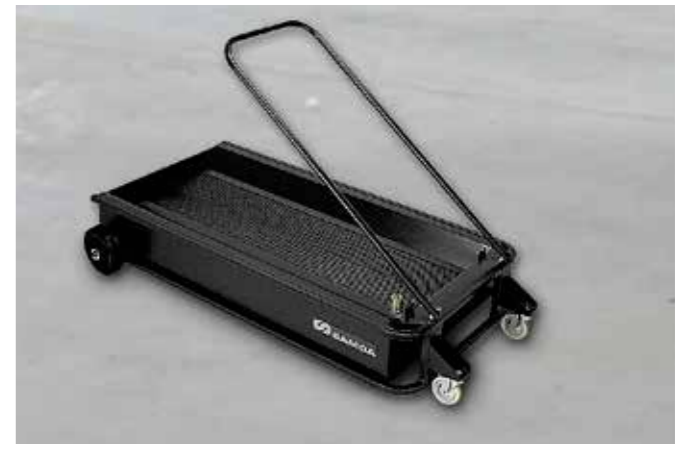
In Isernhagen ständig in Gebrauch: der mobile Altölauffangwagen RAS 95