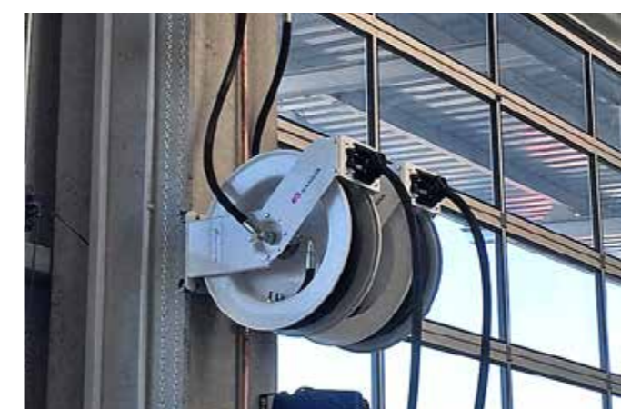
Samoa-Hallbauer-Schlauchaufroller mit reibungsarmen Drehlagern und Drehgelenk mit hohem Durchfluss

tionen. Dazu gehören unter anderem die Gründung von Tochtergesellschaften in England, Frankreich, den USA und die Beteiligung an der Hallbauer Metallwarenfabrik GmbH, die dann in Samoa-Hallbauer GmbH umbenannt wurde. Damit entstand eine schlagkräftige, international aufgestellte Unternehmensgruppe, die in Deutschland über 50 Mitarbeiter beschäftigt und im Werkstattbereich der Kfz- und Nutzfahrzeugbranche sowie generell in der Fahrzeuglogistik und in der Industrie als kompetenter Hersteller zuverlässiger Qualitätsprodukte und Anlagen gefragt ist. Kein Wunder also, dass Samoa-Hallbauer auch bei den letzten großen Standortmodernisierungen der Swecon Baumaschinen GmbH wie selbstverständlich mit an Bord war. Die Vertriebs- und Serviceprofis für Volvo-Baumaschinen hatten bereits im letzten Jahr in Isernhagen den für den Großraum Hannover zuständigen neuen Standort