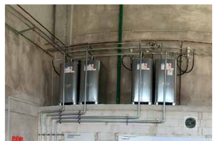
1000-l-Tanks mit Hochdruckverrohrung und Kolbenpumpen PumpMaster 2 DP 3:1 plus mit 42 l/min Förderleistung