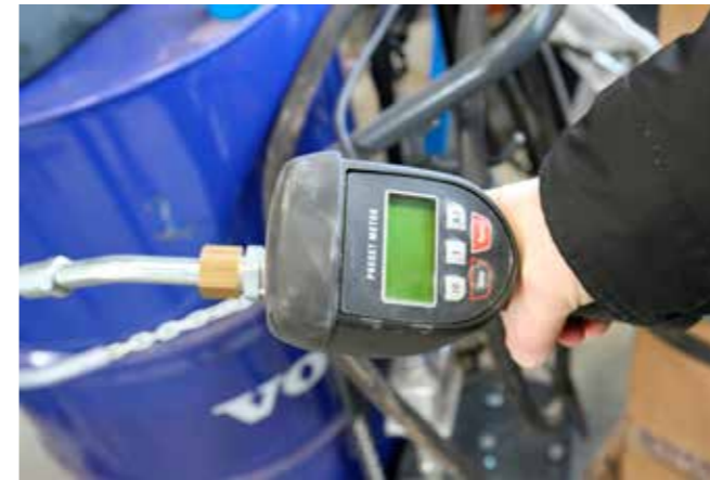
Die Füllpistolen mit Vorwahlmöglichkeit und Elektronikzähler kommen auf eine Messgenauigkeit von \pm 0,5\%