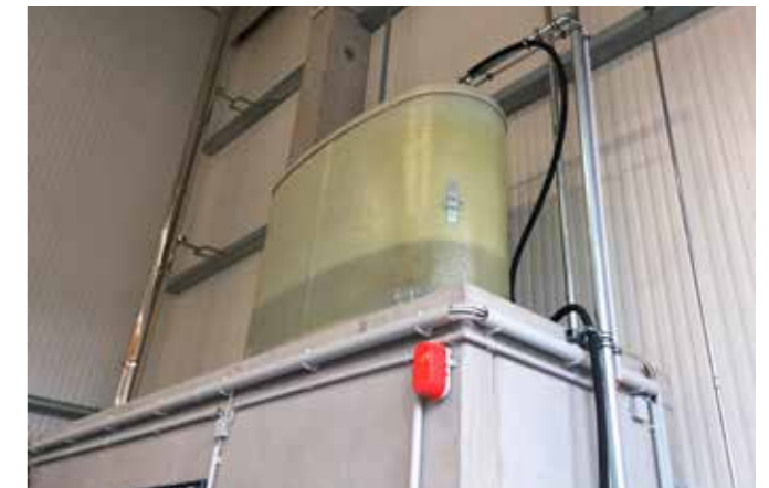
Auf einem Podest in der Werkstatthalle in Hamburg montierter Tank für das anfallende Altöl